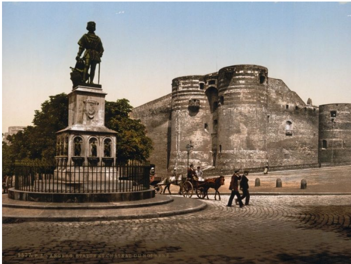
La Statue du Roi René et le château d'Angers en 1853.